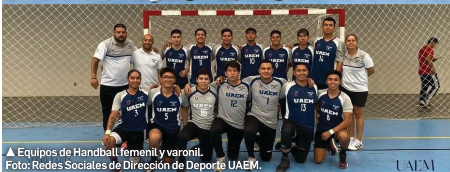
▲ Equipos de Handball femenino y varonil.