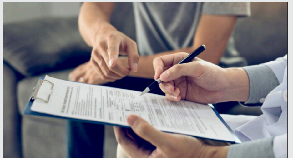
▲ Imagen: Corbis Images

Un ejemplo que evidencia lo dicho, ocurrió en las elecciones de los Estados Unidos en 2016. Todas las encuestas daban como ganadora a Hillari Clinton, sin embargo, el día de las votaciones los resultados no se ajustaron a las predicciones y el ganador fue Donald Trump. Yo no apostaría a la confiabilidad de las encuestas aun cuando sean hechas bajo el más puro rigor científico. Pero usted que me lee tiene su propia opinión al respecto.