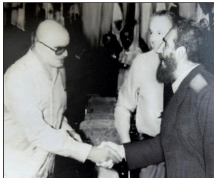
◀ Una de las poquísimas fotos que permitió Fidel se le tomara dando la mano a un sacerdote.