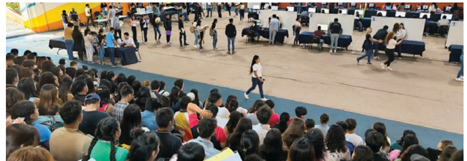
▲ Hasta el momento se tienen 15 mil 639 prerregistros, de los cuales sólo han realizado el pago 6 mil 590.

Finalmente, hizo un llamado a que las y los aspirantes cumplan con este requisito y obtengan su ficha definitiva para participar en el proceso de admisión a alguna de las carreras que ofrece la UAEM.