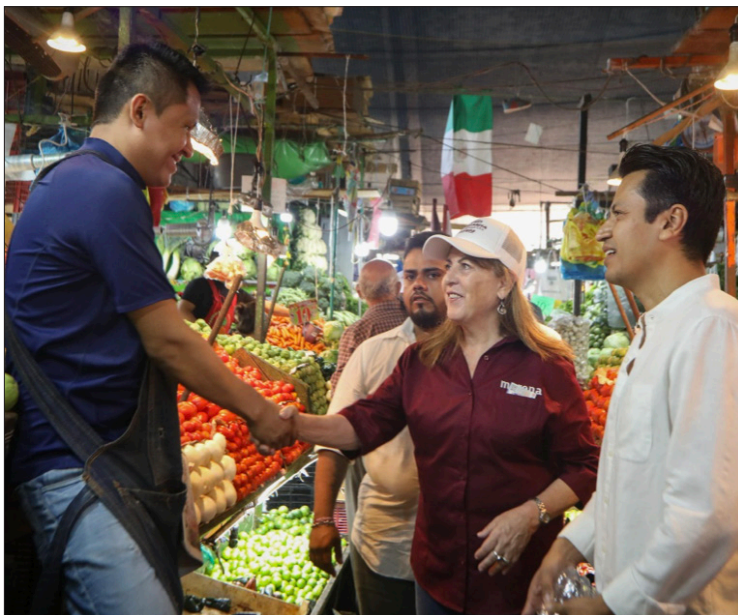
▲ González Saravia dijo que es necesario apoyar la rehabilitación del mercado Adolfo López Mateos y que estas acciones se replicarán en los mercados de todos los municipios.

Dijo que este recorrido tiene relevancia porque en la última visita de Claudia Sheinbaum, candidata a la presidencia de la República, resaltó que Cuernavaca no va a volver a padecer por agua, además de trabajar en temas como el desarrollo y la integración del municipio, porque los capitalinos “merecen un mercado de primer mundo” y se destinarán recursos para que sea una realidad.