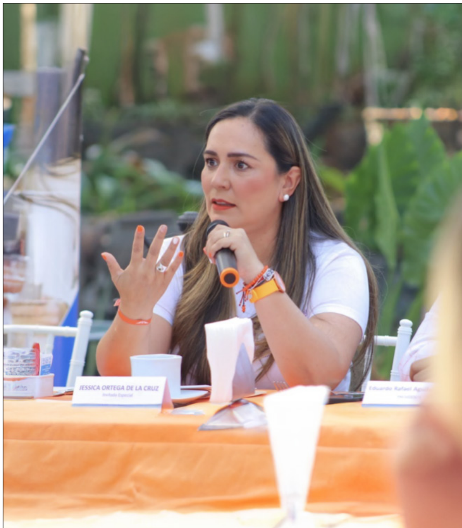
▲ Ante los empresarios, la candidata, habló sobre sus ejes de campaña particularmente en materia de seguridad, desarrollo económico, empleo y turismo.

También se comprometió con los empresarios a fomentar un entorno un entorno favorable; promover la creación de empleo; apoyar a sus empresas; dar prioridad a las empresas morelenses en los contratos públicos; mejorar la infraestructura y servicios; fortalecer las rutas comerciales; prevenir los delitos; fortalecer las fuerzas de seguridad; combatir la corrupción; prevenir la violencia; mejorar el acceso a la atención médica y la infraestructura de salud; mejorar el transporte público y las vías de comunicación; implementar un gobierno digital; fortalecer la infraestructura para agua y saneamiento; combatir el cobro de piso y la extorsión; y apoyar a las incubadoras de empresas.