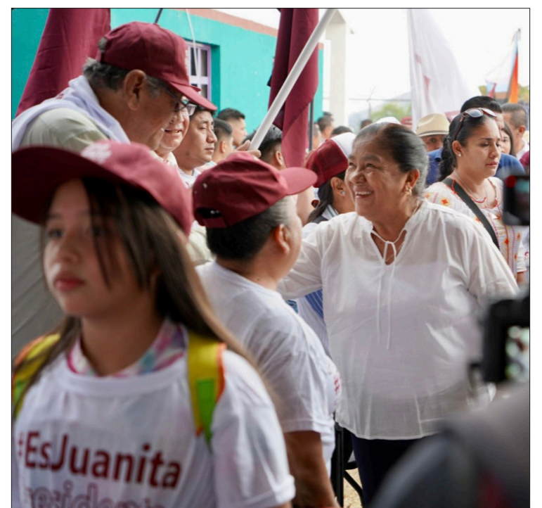
▲ “Tenemos que ampliar la red eléctrica, drenaje y agua potable de cada una de nuestras colonias”, reconoció la candidata