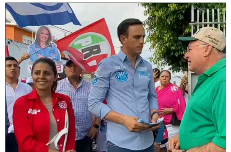
▲ Las principales peticiones de los ciudadanos de la colonia Plan de Ayala, al candidato a diputado fueron el mejorar el servicio de agua potable y aumentar la seguridad.