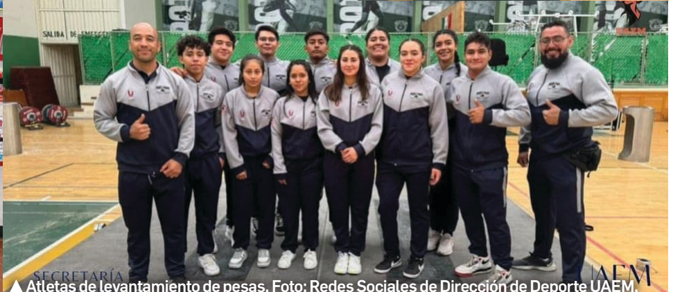
▲ Atletas de levantamiento de pesas.