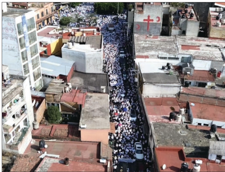
▲ De no cumplirse pronto los acuerdos con el ISSSTE, los profesores están dispuestos a realizar una nueva movilización “incluso antes del primero 1 de mayo”.