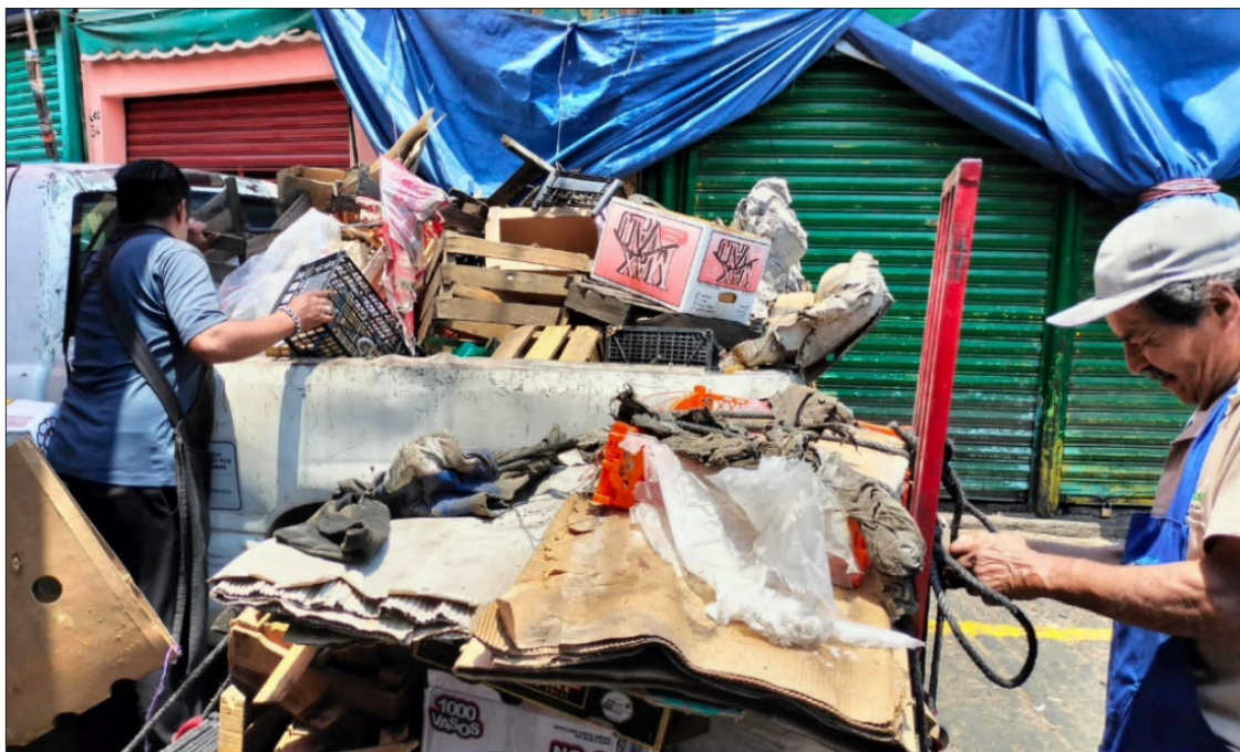
▲ Los operativos de alineamiento en la periferia del Mercado se realizan para que los comerciantes y locatarios respeten el libre tránsito de la población, limitando las actividades comerciales a los espacios dedicados para eso.

En paralelo, la supervisión del mercado mantiene la vigilancia permanente en la glorieta de Los Caballitos para evitar una nueva invasión del arroyo vehicular; y los operativos continuarán en la periferia que corresponde a la protección de mercados que contempla también los andenes, donde se harán labores de restructura, alineamiento y limpieza, teniendo el único objetivo de salvaguardar la integridad física de la población que acude al mercado, informó Bello Olmedo quien recordó que las acciones se realizan con pleno respeto a los derechos de los comerciantes y sin necesidad de utilizar la fuerza pública incluso con el sobreseimiento de los cerca de 35 amparos que interpusieron los comerciantes para impedir ser alineados.