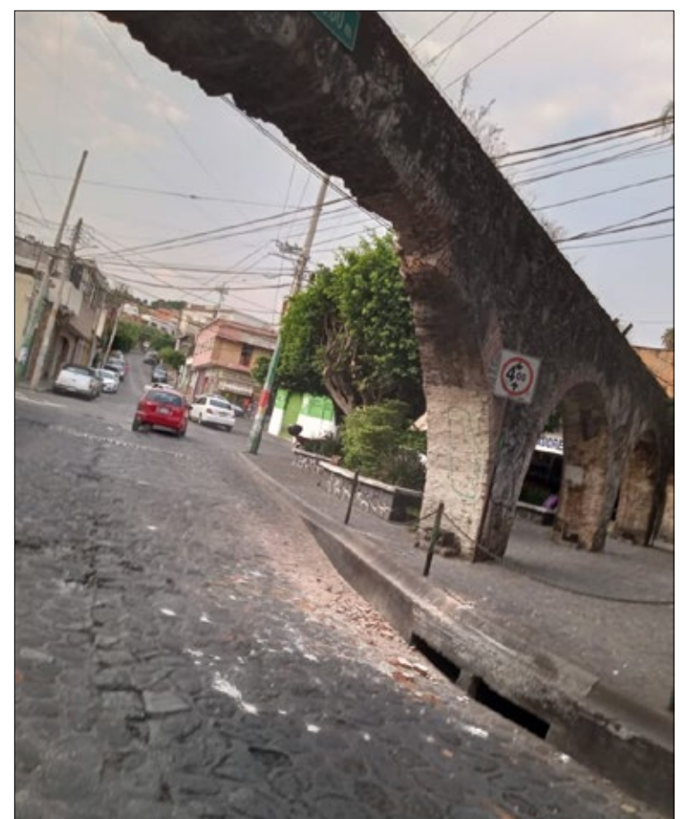
▲ El acueducto que fue incorporado apenas hace 24 años al catálogo de monumentos históricos del Instituto Nacional de Antropología e Historia (INAH).

Puntualizó que entre las posibles soluciones para evitar que esta situación se repita, están considerando la colocación de una estructura metálica conocida como "portería" al inicio de la vialidad que determine su altura y evite el paso de vehículos que rebasen las dimensiones.