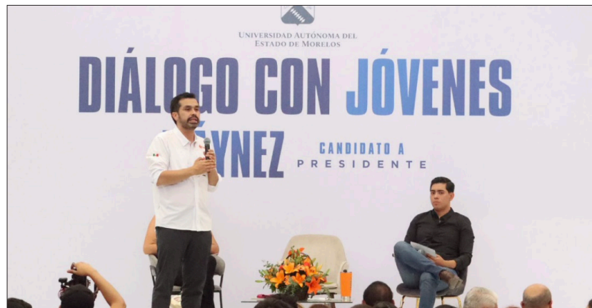
▲ “Vamos a inyectar recursos para que resuelvan sus problemas financieros; las universidades no pueden estar arrodilladas frente al poder y sin autonomía presupuestal”, prometió el candidato a la Presidencia de la República.

Álvarez Máynez aseguró que el formato de los debates a la presidencia es adecuado y que las quejas de sus adversarias por la presidencia, Claudia Sheinbaum Pardo y Xóchitl Gálvez Ruiz respecto al mismo se deben a que “les fue mal, pero en ningún formato les va a ir bien si van a mentir, si van a insultar, si van a atacar... Le echan la culpa al formato, es como los equipos