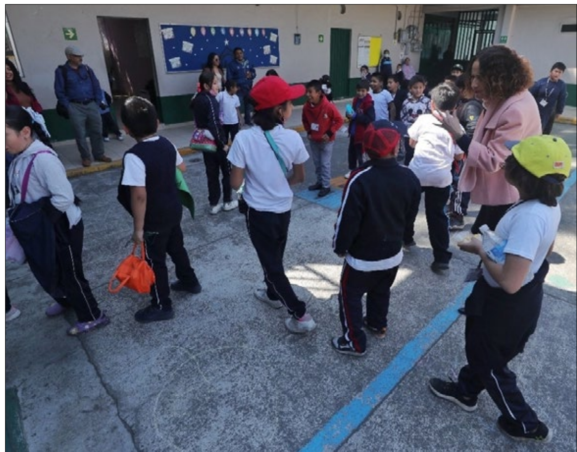
▲ Niños juegan durante su recreo.

Las madres y padres con hijos de cero a 17 años que no vivían con ellos fueron 4.4 millones (13.7 por ciento). Estas personas también participaron en las actividades asociadas al cuidado, comunicación e interacción afectiva con sus hijas e hijos, aunque en menor medida. La Encuesta reportó que nueve de cada 10 (89.9 por ciento) tenían demostraciones de afecto con sus hijos; 70.6 por ciento mantenía pláticas sobre las amistades de sus hijos y 66.8 por ciento estuvo al pendiente de sus calificaciones en la escuela.