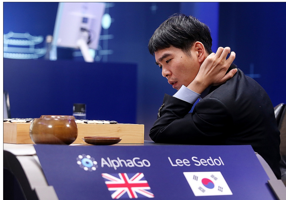
▲ Lee Sedoul

Por el momento las IA's sólo pueden especializarse en una sola cosa. AlphaGo puede vencer a cualquier humano en Go, pero no puede hacer ninguna otra cosa. Lo mismo podemos decir de un brazo robótico que está especializado en operaciones quirúrgicas de precisión sobrehumana. No puede hacer algo diferente a lo que su programación le manda. Desde hace tiempo los humanos también hemos tendido a la especialización. A diferencia de otras épocas, en las que la ciencia buscaba una visión holística, en ciertos terrenos académicos, hoy se privilegia la hiper especialización. Me pregunto si acaso este proceso nos mantiene de nuevo en desventaja, frente a máquinas