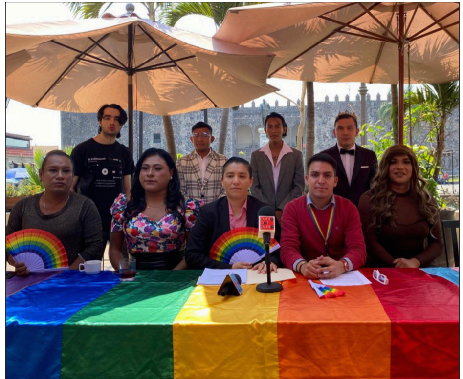
▲ El próximo sábado se realizará el Festival Pride Morelos 2024 para promover la visibilidad y la defensa de los derechos de la comunidad de la diversidad sexual.