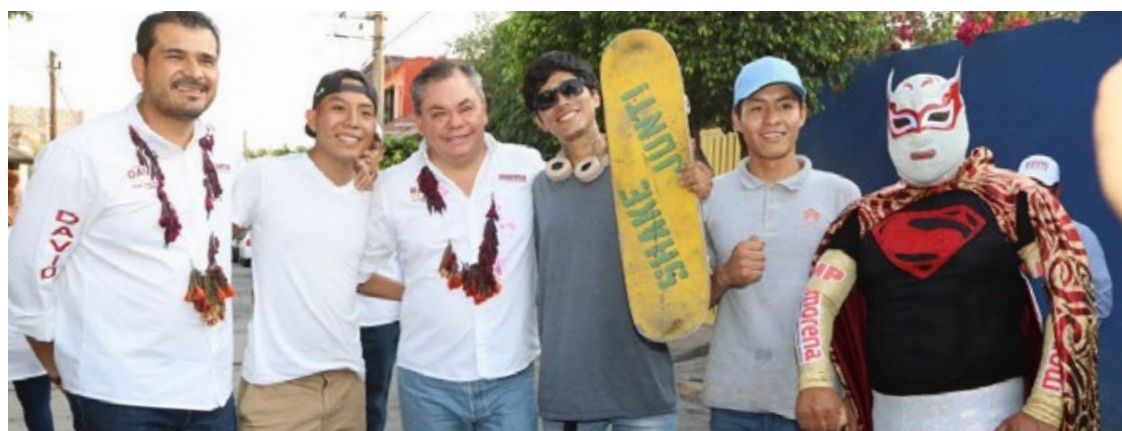
▲ El centro de atención para los animales de compañía (perros y gatos) será un espacio público que estará destinado a la esterilización y a proporcionar las vacunas básicas para las mascotas.

El aspirante a ocupar la alcaldía entre el uno de enero de 2025 y el 31 de diciembre de 2027 ratificó sus compromisos en materia de funciones y servicios públicos, para que continúen siendo de calidad en favor de los jiutepequenses.