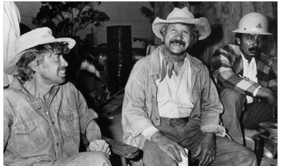
▲ Película Los Albañiles de Jorge Fons, 1976.

Sin embargo, uno de los aspectos más preocupantes es que la mayoría de los trabajadores de la construcción se ubican en el sector informal (90.9%), rebasando por treinta puntos porcentuales el promedio de informalidad en el país (54.8%). Un último aspecto es que la escolaridad promedio es de 7.32 años, equivalente al primer año de secundaria, lo cual contribuye a la falta de perspectivas de superación laboral o de realización de trabajos más especializados que sean económicamente más atractivos. Todo esto ponen en la mesa la falta de capacitación, acceso a tecnologías y a los procesos