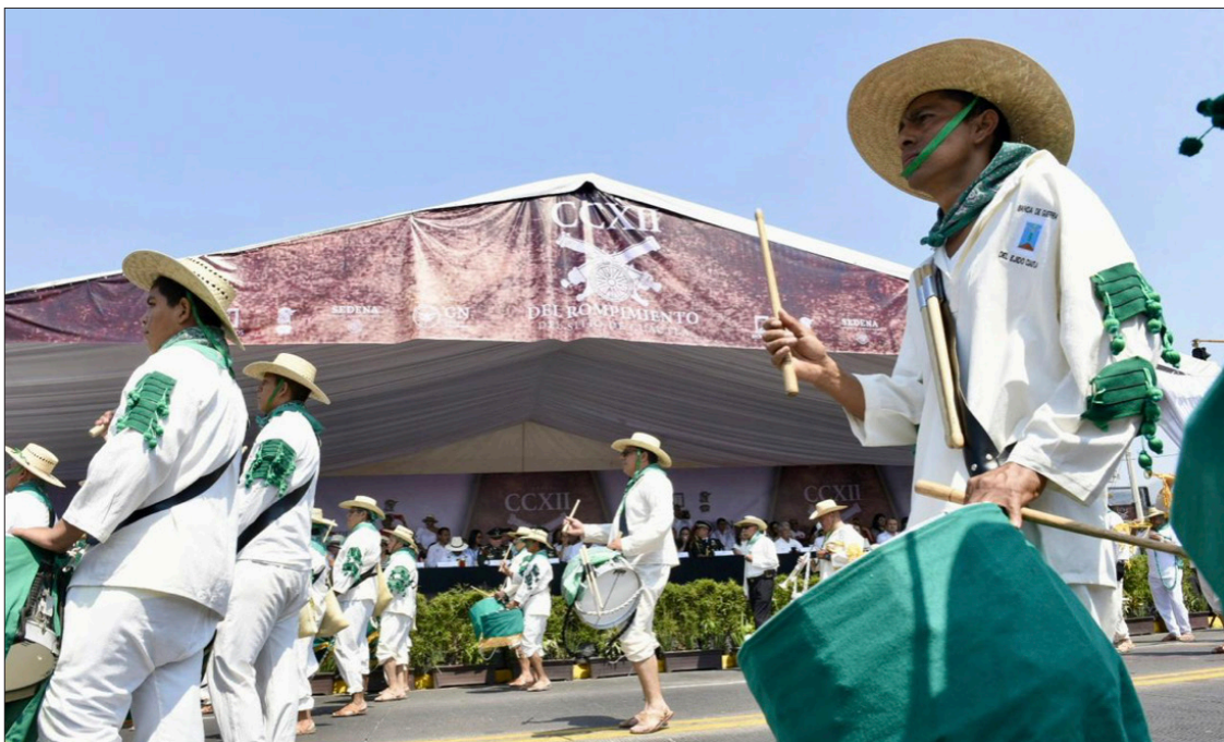
▲ Con sus tradicionales y nutridos desfiles, ayer en Cuatla se recordó una de las gestas que definirían el curso de la Guerra de Independencia.

Luego vino la proclama de José María Morelos y Pavón, a cargo del Ayuntamiento de Cuatla que sirvió de preámbulo al desfile que durante más de una hora y media avanzó por la avenida Reforma de la Heroica.