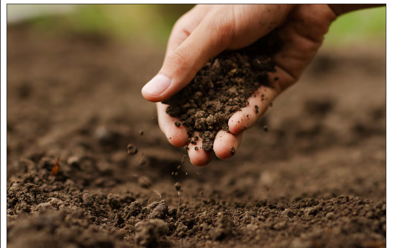
▲ Imagen: Corbis Images