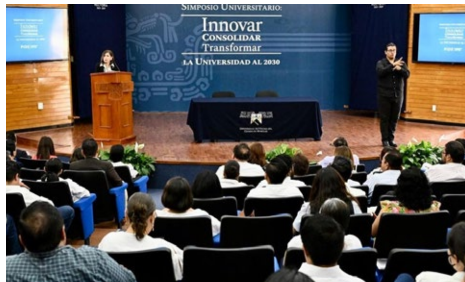
▲ Durante el simposio, se abordaron temas como las políticas públicas de educación superior, la formación de estudiantes, la investigación y la gobernanza y gestión universitaria.

los desafíos con una visión de largo plazo". Por ello, resaltó la importancia del simposio, centrado en la creación de un futuro prometedor para los jóvenes y la comunidad en general.