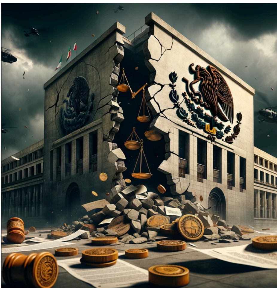
▲ Imagen: Cortesía del autor.