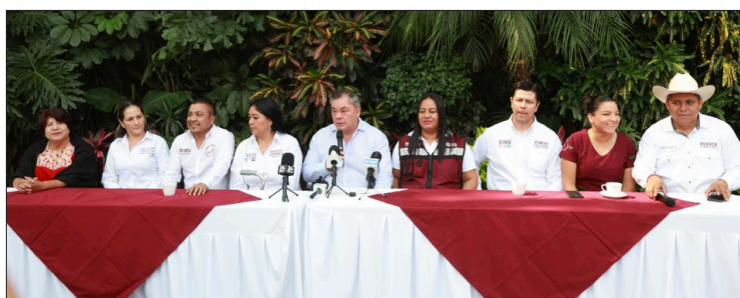
▲ Los candidatos a diputados se comprometieron a atender el problema del agua, empezando por su infraestructura.

Reyes Reyes señaló que en algunos casos la dotación de agua no se