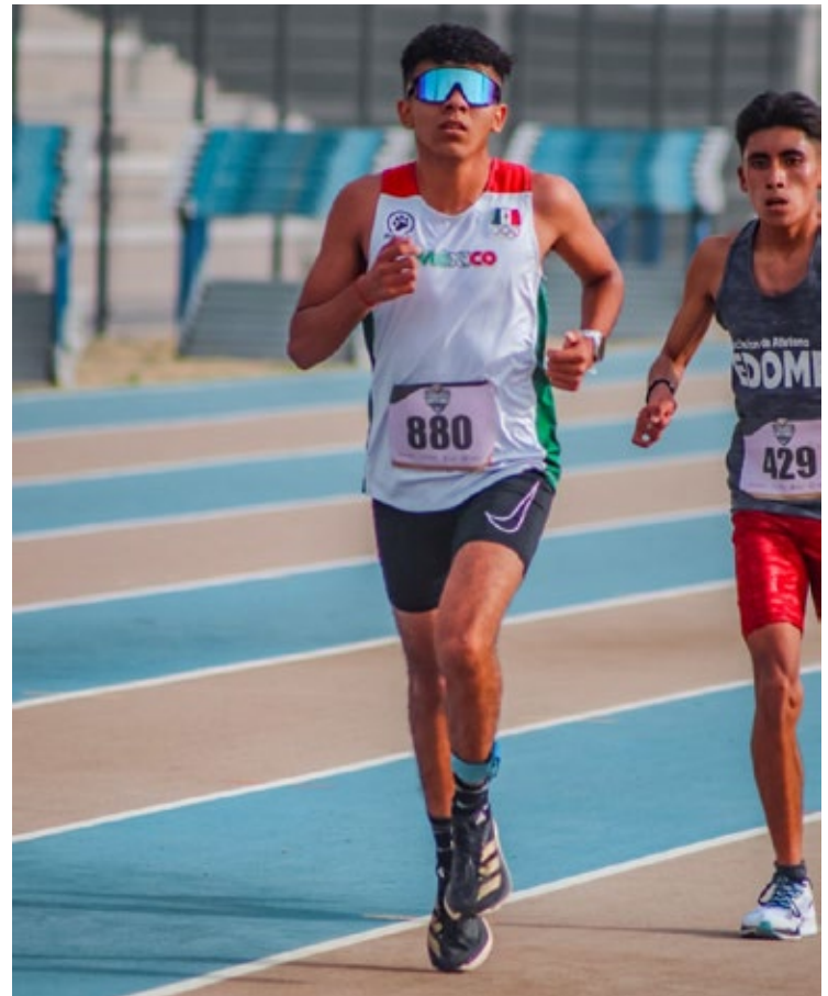
▲ Destacado inicio de participación del representativo morelense en Tonalá, Jalisco.