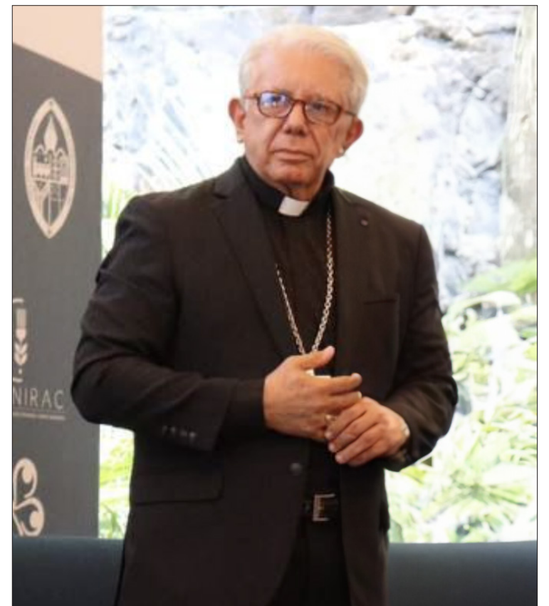
▲ El Obispo de Cuernavaca, Ramón Castro Castro.

En el estado, la iglesia ha escuchado testimonios de personas, tanto de comunidades, parroquias, plazas públicas, escuelas personas de una variedad amplia, quienes coinciden en el mismo clamor por la justicia; por encontrar a sus seres queridos, desaparecidos, así como de muchos morelenses que se han convertido en migrantes huyendo de la violencia.