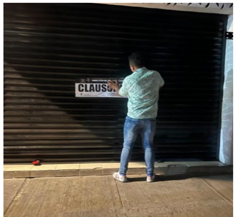
▲ Las clausuras se originaron por documentación incompleta y falta de licencia de operación.

visaron bares y centros nocturnos que operan en las colonias Jiquilpan, Lázaro Cárdenas, Vista Hermosa, Centro, Ampliación Lázaro Cárdenas, Antonio Barona, Buena Vista, el poblado de Chamilpa, Rancho Cortés, el poblado de Santa María Ahuacatlán, Ciudad Chapultepec, Flores Magón, Teopanzolco, Tulipanes, Vicente Estrada Cajigal, Alta Vista, Carolina, Lomas Tzompantle y Lagunilla.