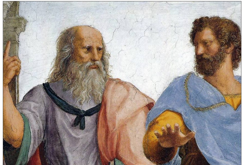
▲ Platón y Aristóteles.

Los políticos están conscientes de la fuerza de la doxa por eso en los debates acuden a las imágenes físicas y también las imaginarias como el de la dama de hielo . Estas son algunas razones por las que las campañas políticas van más a las creencias, las opiniones, ( doxa ) que a la razón ( episteme ).