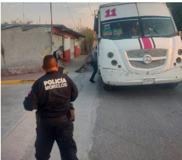
▲ Ya se resguardan los recorridos de la Ruta 11 en Temixco; el Ayuntamiento informó que, tanto el incendio de un vehículo como un asalto en donde resultó herida una mujer, ocurrieron en Cuernavaca.

No obstante, desde el 27 de abril del año en curso arribaron al municipio aproximadamente siete “bases de operaciones” de personal de la Secretaría de la Defensa Nacional (SEDENA) y elementos de la Guardia Nacional quienes se encuentran distribuidos en la totalidad del municipio, con especial atención a “las colonias de alto impacto en incidencia”; los efectivos realizan recorridos de seguridad y vigilancia en distintos horarios y han instalado diversos puntos de inspección.