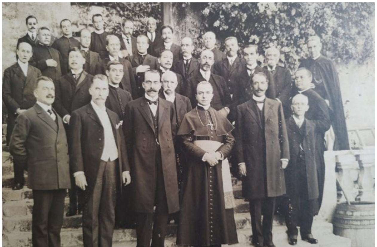
▲ El general Ángeles y el Obispo Fulcheri en Cuernavaca.