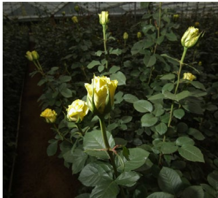
▲ Morelos se ubicó entre los principales productores de crisantemo, rosa, gladiola y azucena, a nivel nacional.

En años recientes, los arreglos florales en estuche o caja (de cartón rígido o acrílico) han cobrado mayor relevancia porque ostentan una presentación novedosa y diferente con su forma simétrica, fresca, cuidada y elegancia.