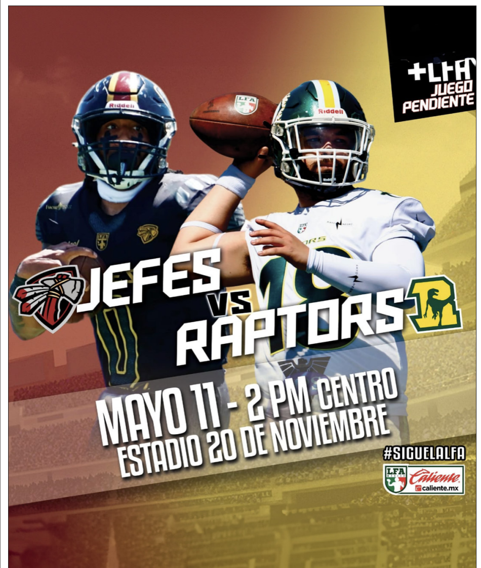
▲ El próximo sábado se llevará a cabo el juego pendiente entre Jefes de Ciudad Juárez y Raptors del Estado de México, que definirá el panorama rumbo a los playoffs.

Los resultados de la última jornada del calendario regular fueron: Dinos 27, Mexicas 24, en dramático juego definido en tiempo extra; Fundidores 45, Gallos 14; Caudillos 28, Raptors 13; y Jefes, que ligaron su tercera victoria consecutiva, 17, Gallos Negros 9.