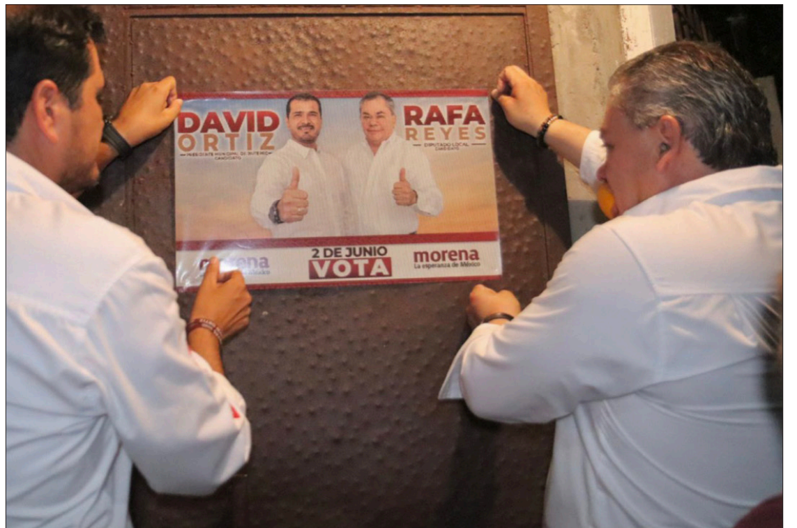
▲ Los candidatos presentaron personalmente sus propuestas en las colonias El Castillo y Pinos Jiutepec.

El morenista señaló que también se dará difusión a la actividad comercial que realizan dichos productores para contribuir a posicionar sus productos en el mercado local; destacando que lo que produce el campo en el municipio es de una alta calidad y compite por sus precios justos.