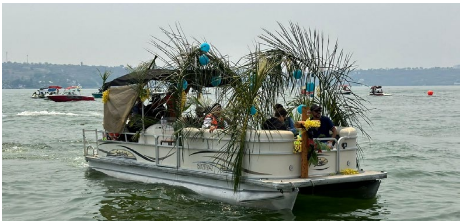
▲ La procesión acuática de la Fiesta de la Ascensión pudo ser atestiguada por los fieles en diversas embarcaciones.