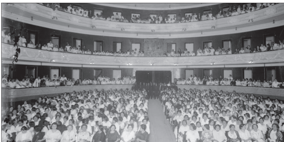
▲ Primer Congreso Feminista en México.

Por ello es importante considerar el mensaje que se está transmitiendo este día y la manera en que se quiere honrar y celebrar a las madres. Dejemos de reforzar la idea de que la maternidad es trabajar de manera gratuita cuidando a la familia. Optemos por regalos más personalizados, significativos y centrados en el bienestar y los intereses individuales de la madre para expresar nuestro aprecio y gratitud a ellas, las que, sin dudarlo, darían la vida por nosotros.