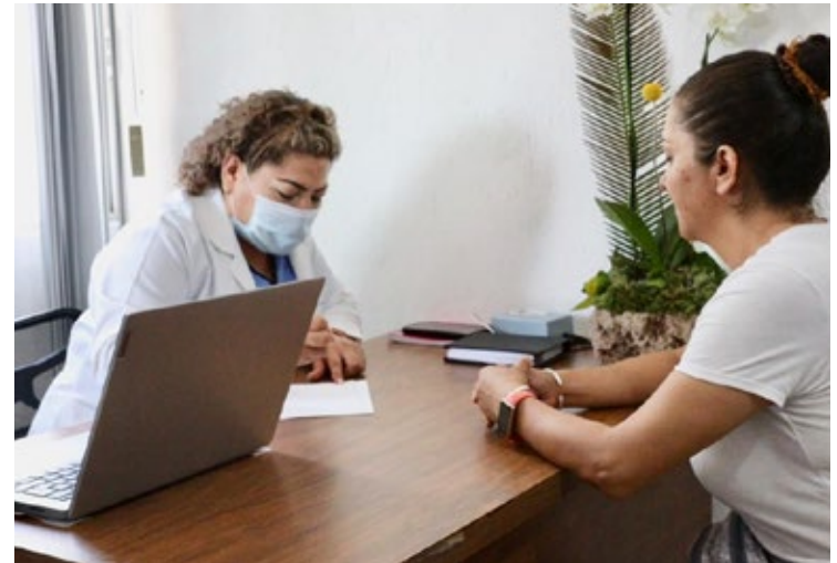
▲ La administración municipal opera un consultorio de salud femenina en el cual se realizan estudios de papanicolaou y colposcopia.