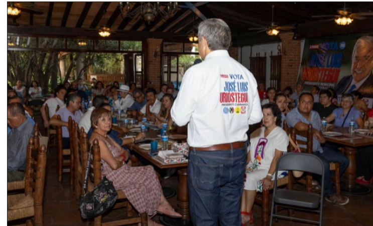
▲ El candidato a la alcaldía de Cuernavaca se reunió con trabajadores de la educación.

Antes de finalizar dicho encuentro, se comprometió a emprender un programa municipal para mejorar los planteles educativos, que comprende entre otras cosas la remodelación de techumbres. Además, apoyará con becas a las y los estudiantes, lo que brindará oportunidades de capacitación continua.