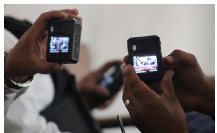
▲ Las cámaras corporales de la policía, además de incentivar el comportamiento adecuado de los servidores públicos, "servirán como mecanismo de protección para los policías viales ante posibles agresiones".

Las cámaras corporales además de incentivar el comportamiento adecuado de los servidores públicos, "servirán como mecanismo de protección para los policías viales ante posibles agresiones o conductas inapropiadas de personas que llegan a resistirse a acatar actos legítimos de la autoridad municipal", asegura la Sepnac.