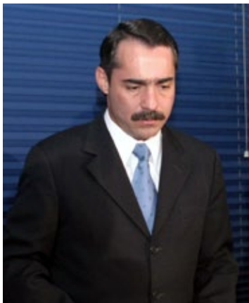
▲ Sergio Estrada Cajigal en 2004.

La audiencia oral se llevó a cabo este jueves en los juzgados de primera instancia con sede en Quintana Roo,