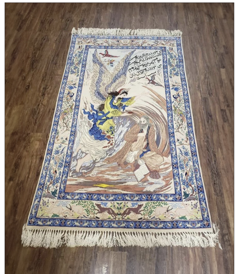
▲ Ilustración: Cortesía del autor