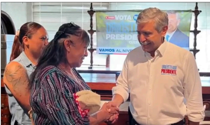
▲ El candidato de la coalición "Dignidad y Seguridad por Morelos, Vamos Todos", mencionó que en Cuernavaca se seguirán impulsando los programas y proyectos a favor de las mujeres.

El candidato de la coalición "Dignidad y Seguridad por Morelos, Vamos Todos", mencionó que seguirá impulsando los programas y proyectos a favor de las mujeres de Cuernavaca, como lo es el programa "Jefas de Familia", cursos y capacitaciones para el autoempleo, talleres de superación personal, de emprendimiento, todo ello, para crear un entorno donde puedan desarrollarse plenamente, sin barreras injustas ni inequidades de género.