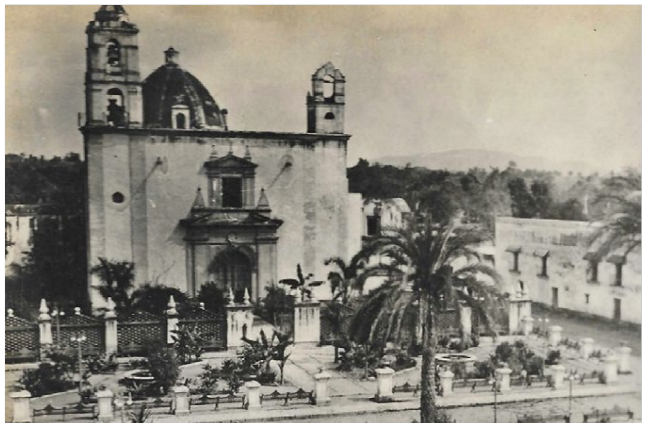
▲ Imagen: Templo de Santo Domingo de Guzmán y plaza (fragmento); Cuautla, Morelos; ca. 1920.

Los crímenes del zapatismo. Apuntes de un guerrillero; Antonio D. Melgarejo; primera edición; F.P. Rojas y Cía; México, 1913; 170 pp.