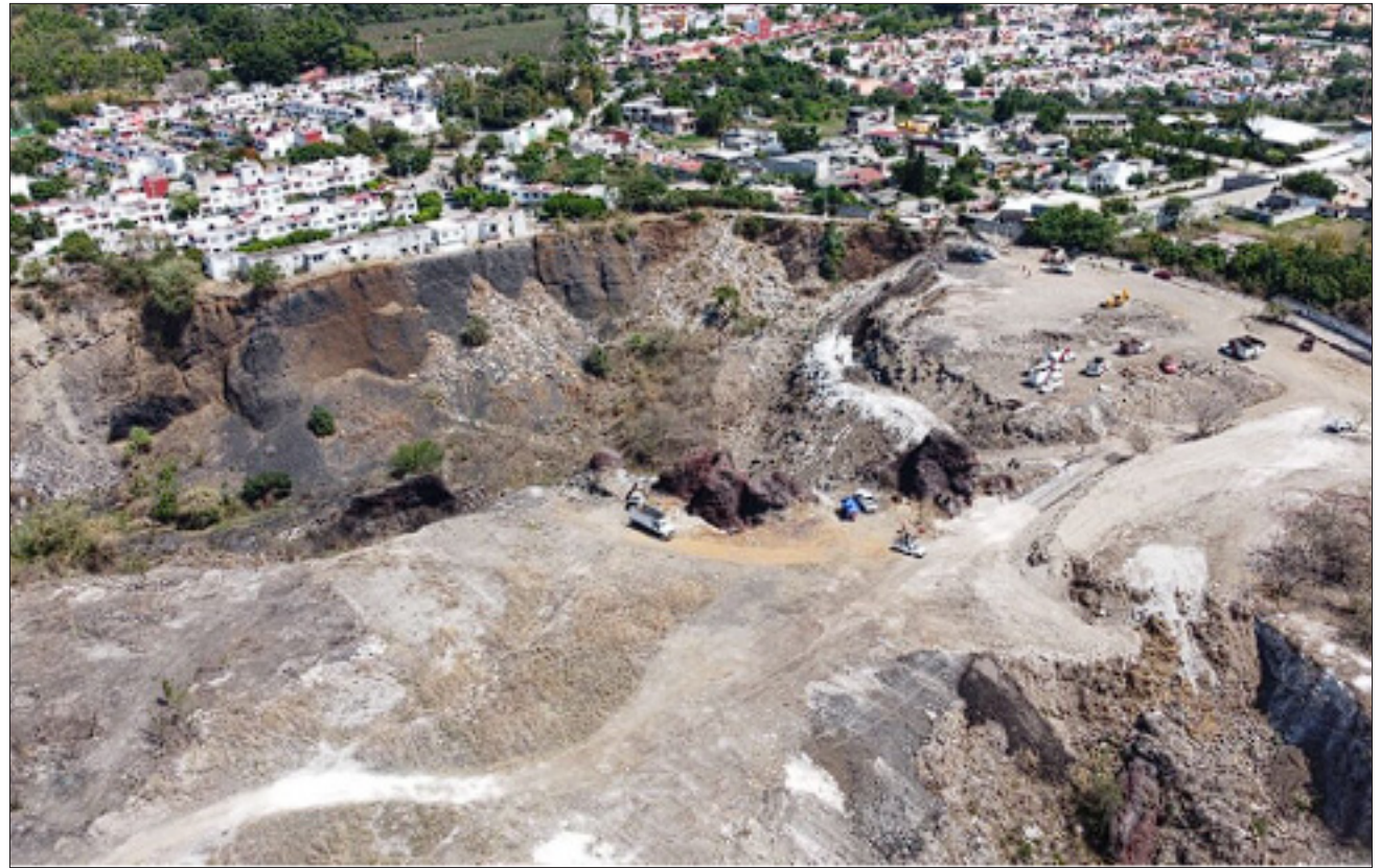
▲ Los trabajos de remediación en la exmina de Tezontepec, en Jiutepec, comenzarán el 24 de mayo próximo.

El comunicado concluye: "El Gobierno de Jiutepec refrenda su compromiso de continuar trabajando, como ha sido desde el primero de abril del año 2023, para atender la situación ambiental en la ex mina de Tezontepec".