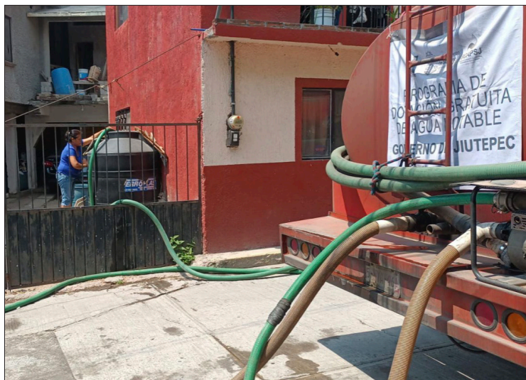
▲ Desde el pasado mes de marzo, el municipio puso en marcha un programa extraordinario de abasto de agua para hacer frente a la sequía.

En el presente periodo prolongado de tiempo seco, decretado por el Servicio Meteorológico Nacional (SMN), es fundamental la participación de la población del