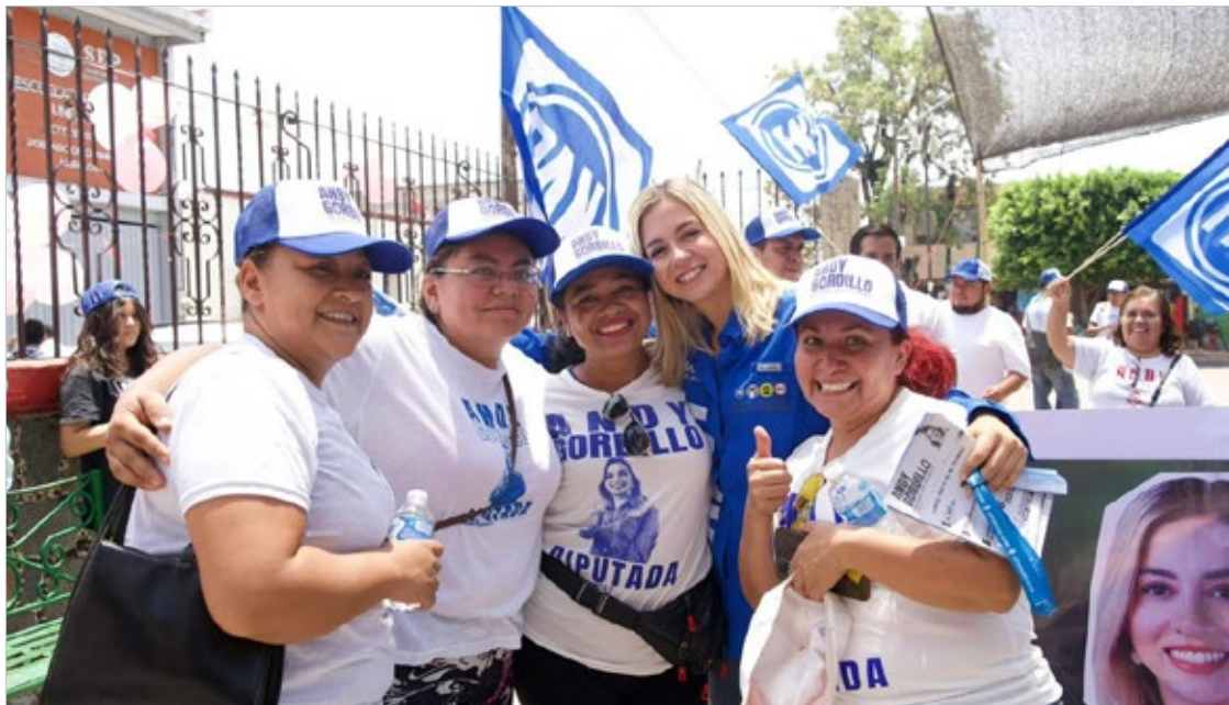
▲ La candidata a diputada local realizó un intenso recorrido en el poblado de Chamilpa y la colonia Universo en donde ha encontrado apoyo incondicional de la ciudadanía.

Finalmente, refirió que continuará con sus volantes, juntas vecinales, actividades y recorridos para llegar a cada comunidad y dar a conocer el proyecto que abandera, escuchando las necesidades y poniendo al centro a las personas que con su voto y confianza la harán llegar por segunda ocasión al Congreso de Morelos.