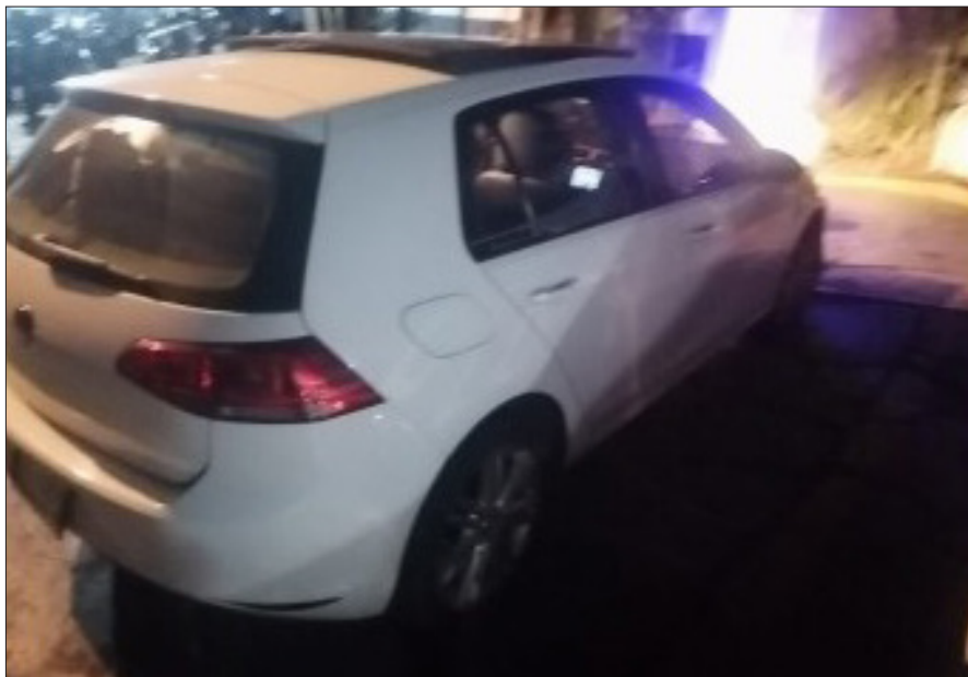
◀ Auto robado recuperado por el Ayuntamiento de Cuernavaca.

El robo de un automóvil no solo implica la pérdida material del vehículo, sino que también de objetos personales, documentos importantes y en muchos casos, la sensación de seguridad y confianza de las autoridades.