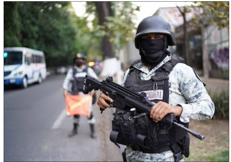
▲ Las colonias: Milpillás, Lagunilla y Altavista, son las de mayor incidencia delictiva en Cuernavaca.