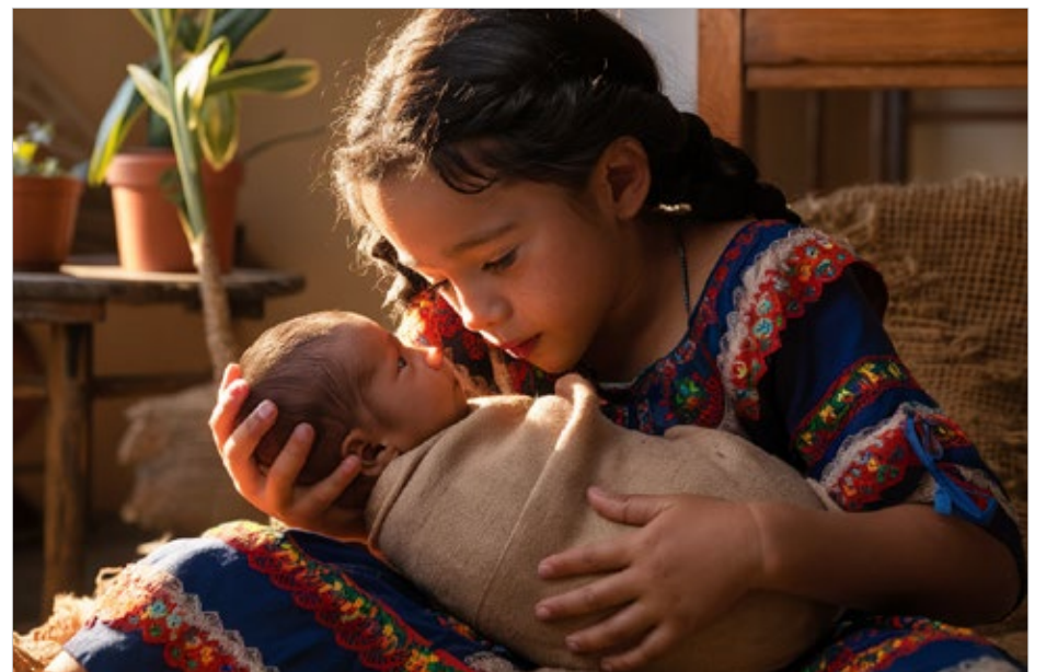
▲ Imagen: IA

Ahora bien, la misma Comisión resalta que las NNA tienen un derecho intrínseco a la vida en infancia, garantizando en la mayor medida posible la supervivencia y el desarrollo del niño, siendo necesario para la realización de su proyecto de vida .