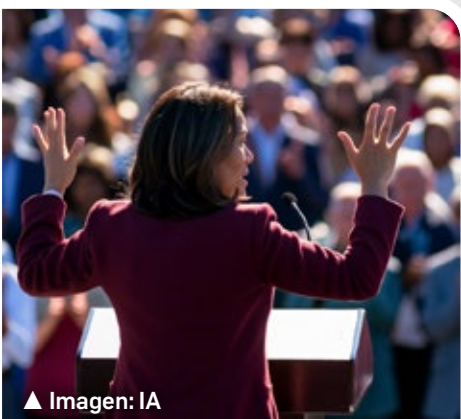
▲ Imagen: IA

También es comprensible que varios aspectos o realidades sociales no se reflejen o contemplan en los programas de los candidatos, pero al menos su presencia o ausencia indica cuáles son