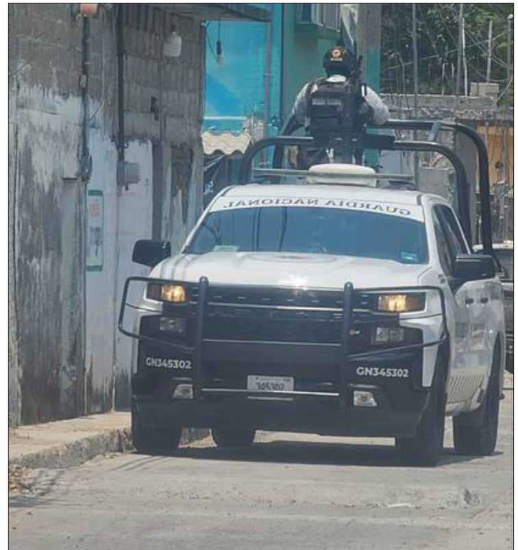
▲ Se requiere involucrar a la comunidad para inhibir la delincuencia, señala la CIDHM.

De acuerdo a cifras dadas a conocer por la Secretaría de Seguridad y Protección Ciudadana (SSPC), abril se confirma como el mes más violento del 2024 con un total de dos mil 622 homicidios dolosos en el país, y que incluyen a Morelos entre los seis estados que concentran casi la mitad de estos delitos.