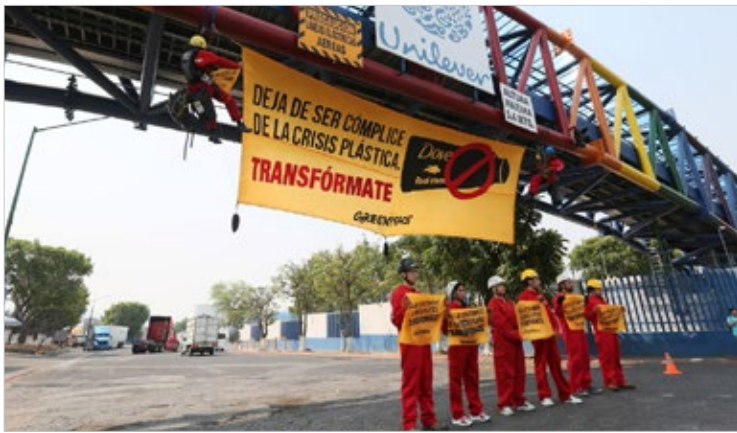
▲ Aunque la empresa trasnacional se comprometió a disminuir gradualmente su producción de envases de plástico desde 2010, en realidad la ha aumentado, acusó Greenpeace.

La organización señaló que Unilever prometió reducir su producción de sachets o empaques miniatura desde 2010, aunque, en realidad, la han incrementado a 475 miles de millones de empaques en la última década, produciendo entre 1 y 2 mil millones de estos empaques cada año, y solo el 0.2% de sus envases de plástico son reutilizables.