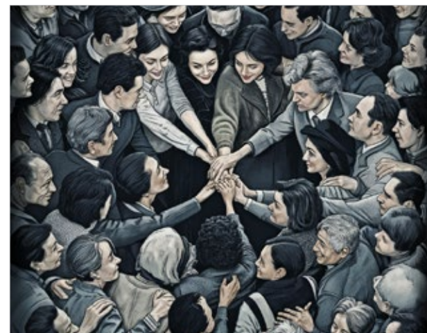
▲ Imagen: IA

Quedamos pendientes de las declaraciones que resulten de la convocatoria del Vaticano para la construcción de la Paz a partir de la hermandad humana.