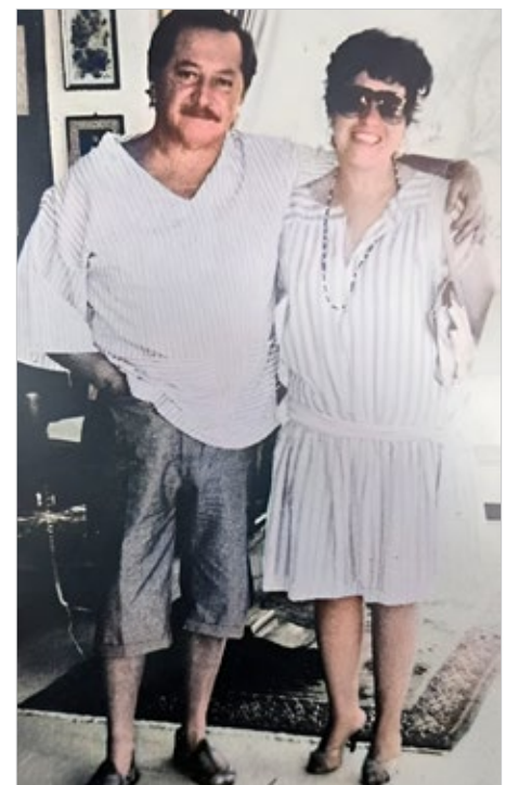
▲ Lya al final de la entrevista con el genial escritor.

“Sin embargo es más fácil exaltar a un héroe porque a un escritor hay que leerlo primero y esto resulta ya más latoso para mucha gente, además, recuerde que el escritor nunca está de acuerdo con nada, este es su mérito. Todo lo pone en entredicho, si no, no es un escritor