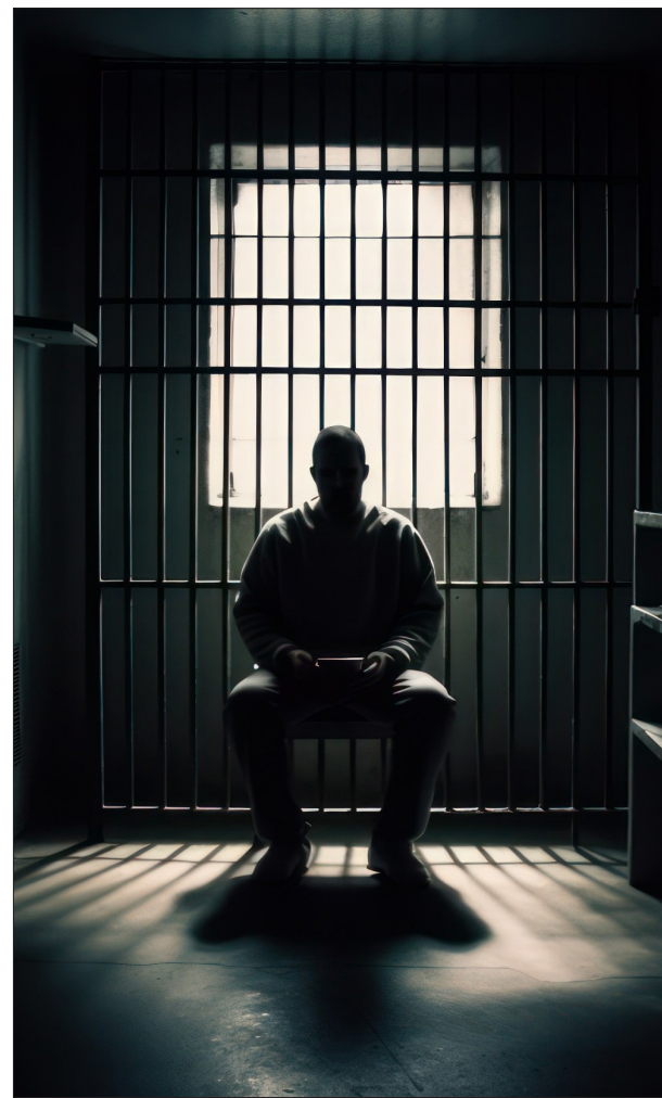
▲ Imagen: Getty Images