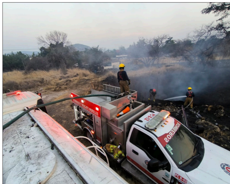
▲ El ayuntamiento de Jiutepec informó que el incendio que se registró desde la tarde del pasado martes en la ex mina de Tezontepec, fue superficial.

Por otra parte, las autoridades municipales aclararon que la Secretaría de Desarrollo Sustentable (SDS) en Morelos determinó la aprobación del recurso del Fondo Verde, y no la cámara de diputados. Señalaron que en una sesión de un comité en que participan autoridades del Poder Legislativo, Ejecutivo y la Secretaría del Medio Ambiente y Recursos Naturales (Semarnat), se determinó el destino de los proyectos viables, en un concurso dirigido para la iniciativa privada, entes privados y dependencias públicas. Dicho comité eligió al ayuntamiento de Jiutepec como destino de dos millones 500 mil pesos del Fondo Verde para el cuidado del medio ambiente.