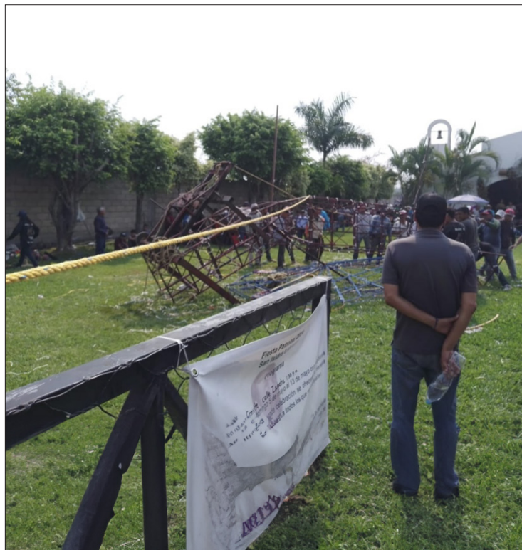
▲ Dos personas resultaron lesionadas al colapsarse la estructura de los fuegos pirotécnicos.

Los paramédicos atendieron a las personas en el lugar, resultando una solo con golpes leves y otra más debió ser trasladada al hospital para su atención por el tipo de lesiones que presentaba.