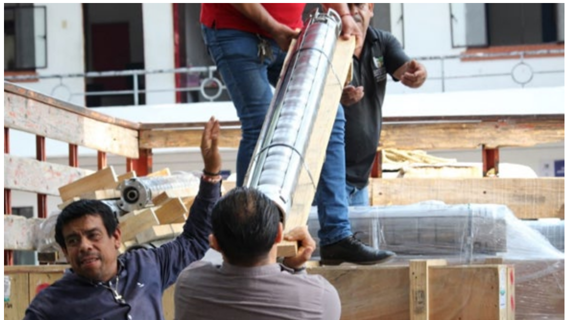
▲ El equipo nuevo sustituirá equipamiento obsoleto o de menor potencia que ya no cubren el servicio que demanda la población de, por lo menos 65 colonias de la capital.

dez, agradeció y reconoció la voluntad política del Ayuntamiento y su Cabildo para dotar de este equipo que facilitará de manera significativa la distribución del agua potable que ha sido el talón de Aquiles en Cuernavaca, mencionando que si una bomba se descompone se deja sin servicio a varias colonias, lo que dejará de ocurrir con lo entregado esta ocasión.