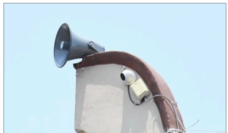
▲ Las bocinas de los dos sistemas de alerta sísmica tienen un alcance de 400 metros a la redonda y podrán alertar cada una a cinco mil personas aproximadamente.