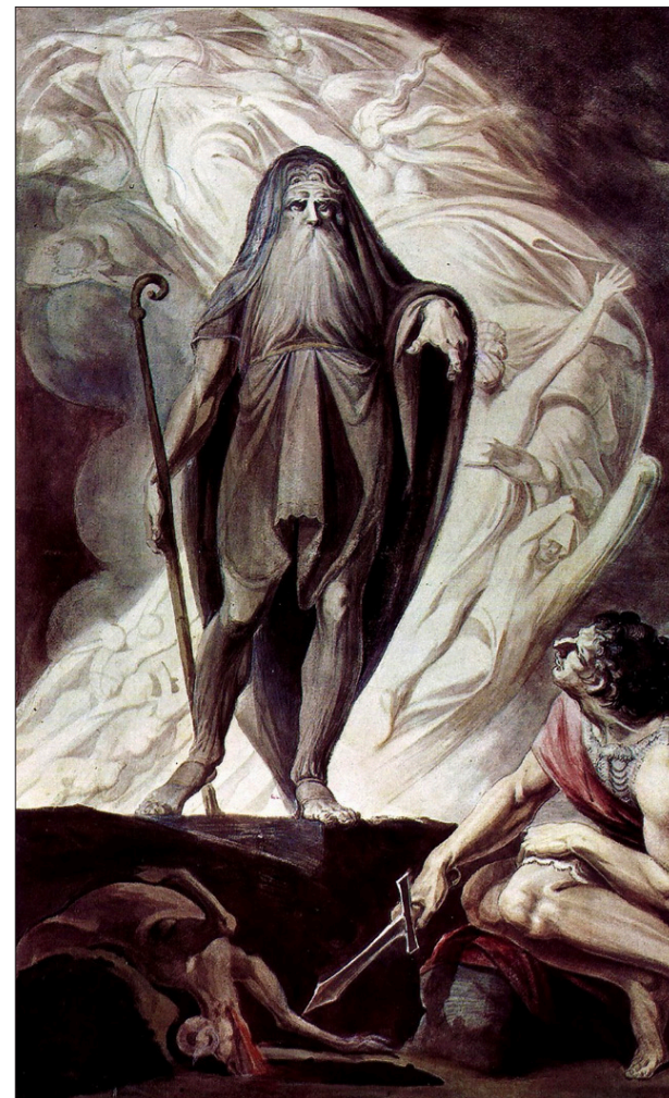
▲ Tiresias aparece ante Odiseo durante el sacrificio, Heinrich Füssli, 1780-85. Graphische Sammlung der Albertina (Viena)

(...) todo se encuentra poblado de dioses, el hombre está lejos de tener un espacio propio, de sentirse libre, antes bien, se siente poseído: posesión divina, manía divina. Esta posesión se refleja, se refracta en la poesía: fruto del delirio divino, no de la sabiduría humana, como en su momento señalaron los griegos. La poesía no es nuestra, sino de los dioses. Allí encuentra Zambrano a Platón, quien como guerrero trataría, en ese espacio poblado todo de dioses, de ganar algo para el hombre: el conocimiento. Platón encarna la lucha entre filosofía y poesía: un enfrentamiento proveniente no del logos , sino del delirio primero. Y es que Platón vivía en medio del terror trágico, de la injusticia divina representada en la tragedia, donde el destino del hombre se le escapaba a él mismo de las manos.