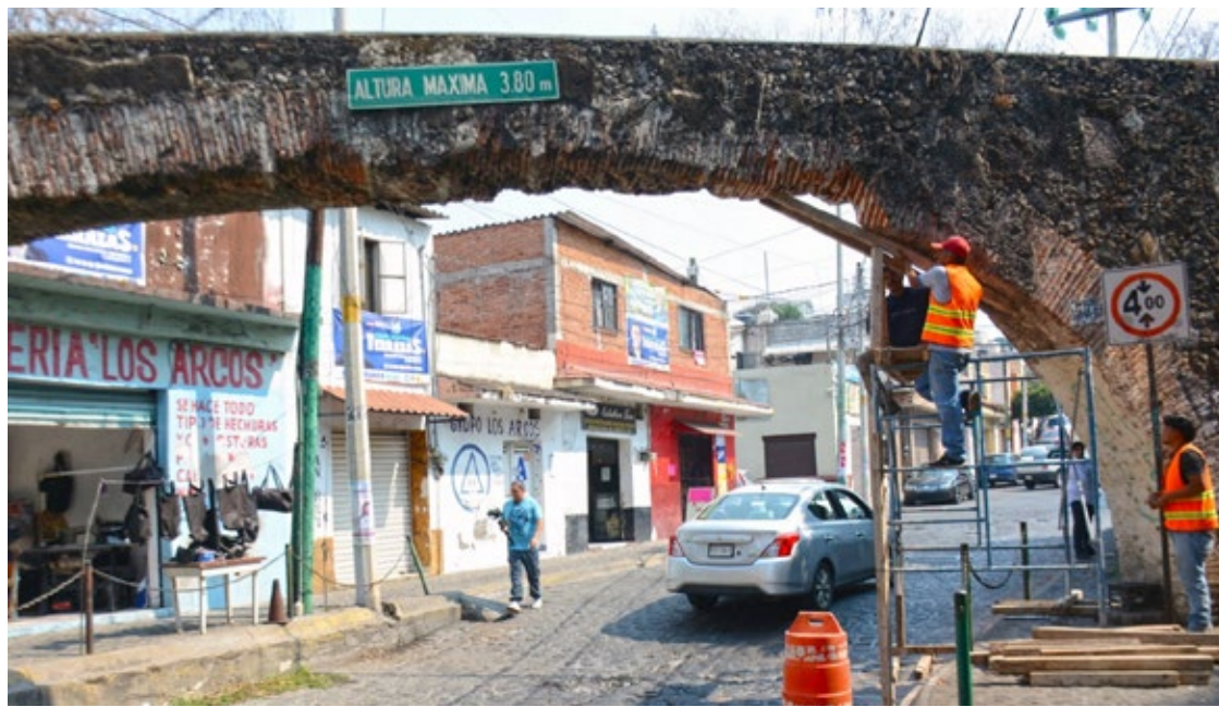
▲ Se invertirán cerca de 75 mil pesos para la construcción de dos arcos metálicos que delimitarán el ancho y altura de los vehículos para prevenir futuras afectaciones.