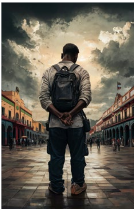
▲ Imagen: IA

En una reunión de trabajo llevada a cabo el 10 de mayo de 2024 en el Salón Morelos del Palacio de Gobierno, los pueblos indígenas y comunidades afrodescendientes plantearon importantes temas de la agenda política al más alto nivel del Ejecutivo del Estado, para que sean valoradas y tomadas en cuenta para el desarrollo de las políticas públicas y la garantía de los derechos colectivos establecidos constitucionalmente, en momentos de definición que van más allá del proceso electoral, ya que el libre ejercicio de la voluntad popular no está reñido