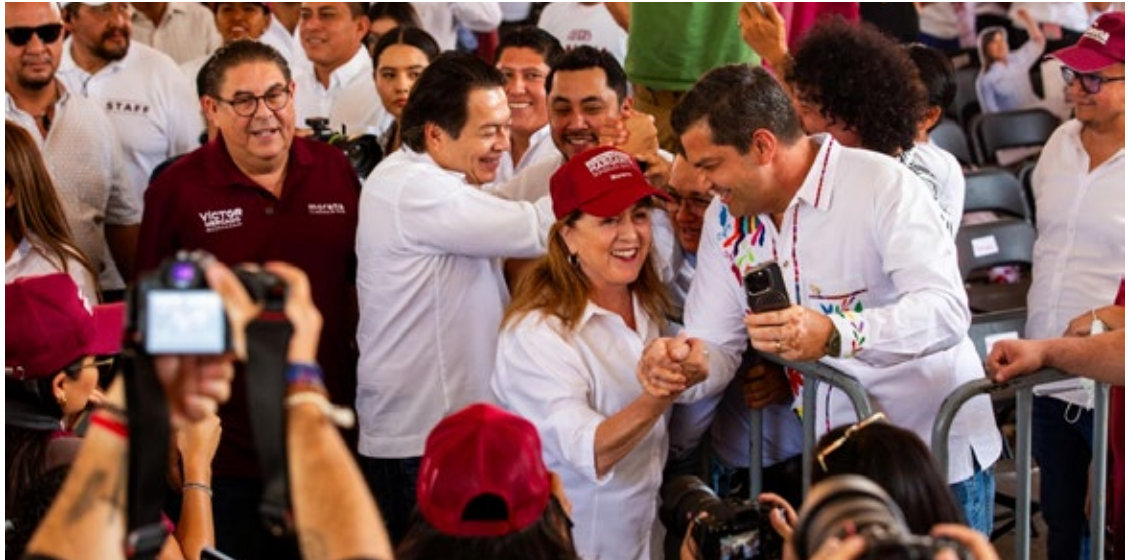
▲ Margarita González Saravia y Mario Delgado Carrillo presentaron un equipo de más de cinco mil "defensores del voto" para la elección del 2 de junio.

Al tomar la protesta de la estructura de defensa de la Cuarta Transformación en Morelos, Mario Delgado Carrillo, enmarcó que defender la decisión del pueblo morenense jugará un papel histórico porque con ella se de-