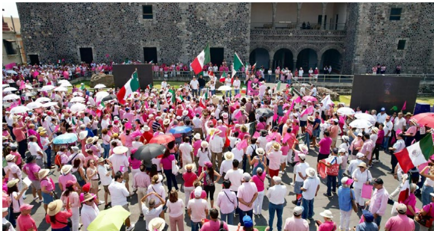
▲ Cientos de ciudadanos participaron en el mitin de la Marea Rosa en el centro de Cuernavaca.

candidatos deben honrar esa civilidad y llamó al voto útil este dos de junio para evitar que se pongan en riesgo la democracia y las libertades ciudadanas.