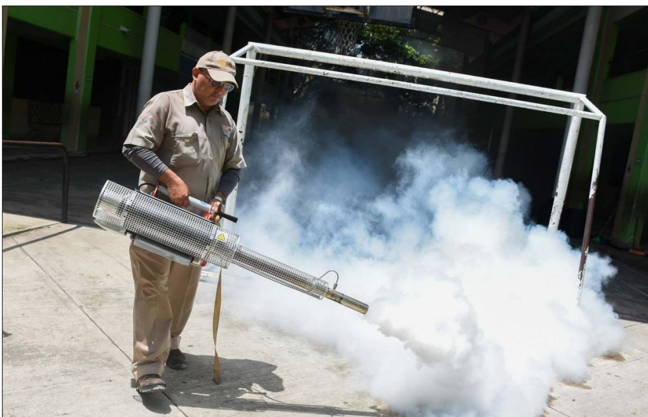
▲ Piedefoto.