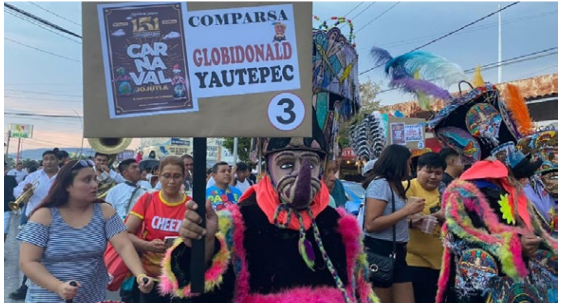
▲ Ni la fuerte lluvia detuvo el brinco del Chinelo en el carnaval de Jojutla.

Los festejos concluyen este domingo 19 de mayo con la presentación de la Orquesta Filarmónica de Acapulco a las 19 horas en el auditorio municipal Juan Antonio Tlaxcoapan, con entrada libre.