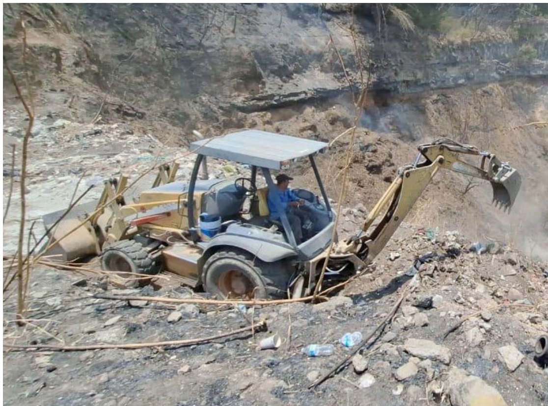
▲ Un par de máquinas trabajan en la primera etapa de remediación de la contingencia ambiental que provocó un incendio en la ex mina.

Para los trabajos, el ayuntamiento cuenta con la asesoría de Construcción Terol S.A. de C.V. en la realización de las obras que tienen como finalidad procurar la salud de la población y mitigar los riesgos ambientales.