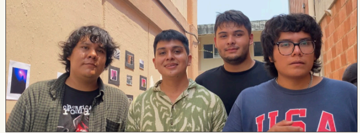
▲ Organizadores de la exposición, alumnos de Ciencias de la Comunicación del Instituto de Investigación en Humanidades y Ciencias Sociales (IIHCS) de la Universidad Autónoma del Estado de Morelos (UAEM).

La elección del callejón como espacio expositivo es significativa. Es un espacio alternativo, un lugar público no ocupado que brinda la libertad de apropiarse del entorno para exponer arte. Además, esta elección busca reactivar espacios de la universidad que usualmente no tienen un propósito definido. “Nos hemos dado cuenta de que hay muchas áreas que nadie las ocupa para nada y quisimos darles un objetivo”, añadieron.