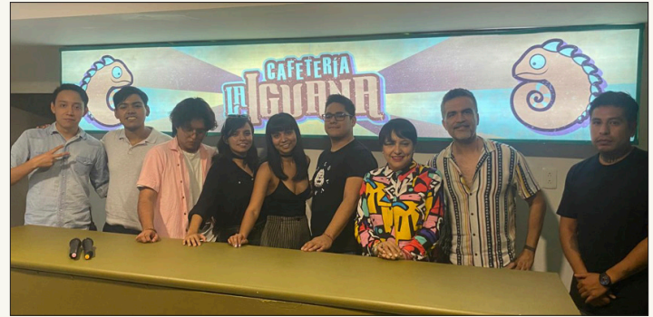
▲ Jurado del festival con los organizadores.