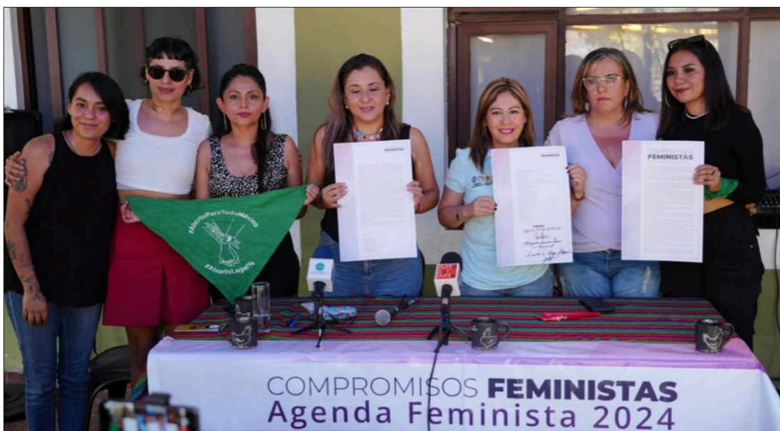
▲ participación en las urnas en las próximas elecciones es fundamental para su triunfo.