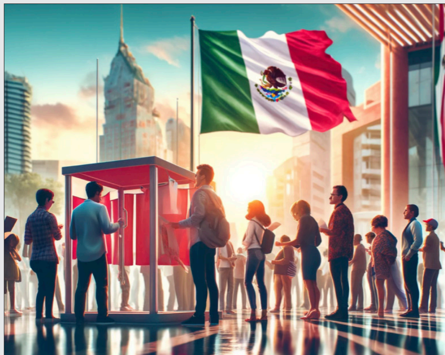
▲ Imagen: elaborada con Inteligencia Artificial.